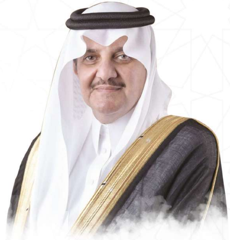
صاحب السمو الملكي الأمير