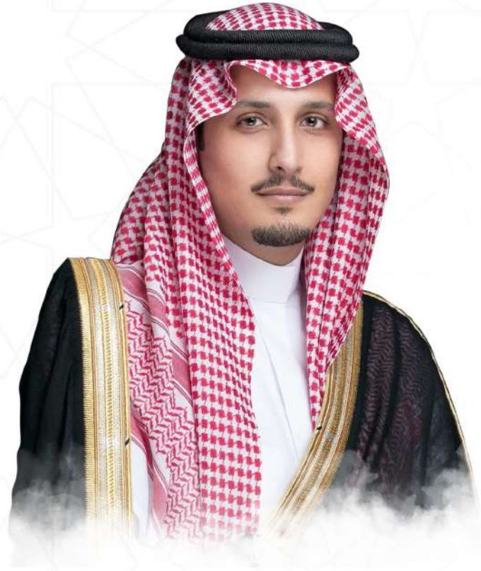
صاحب السمو الملكي الأمير

أحمد بن فهد بن سلطان بن عبدالعزيز آل سعود